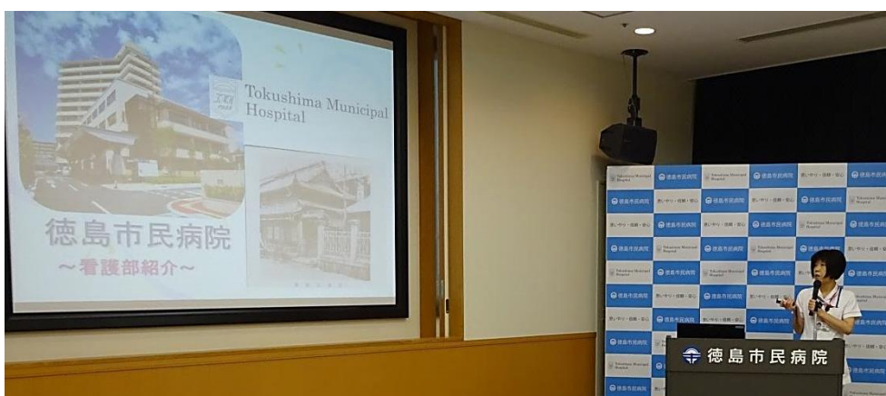
看護部長より組織について学びました