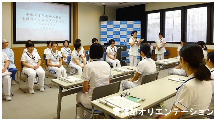
看護部オリエンテーション