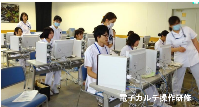
電子カルテ操作研修