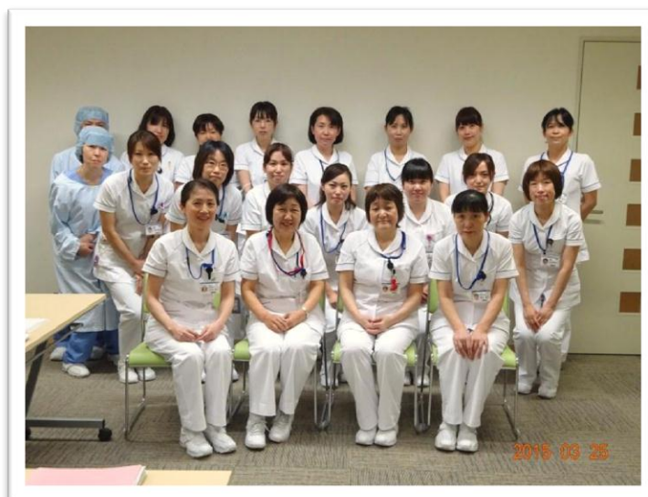
新人研修指導者たち